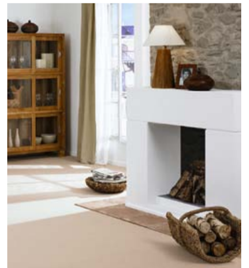
Überall sehr gut: der Bingo von Vorwerk.