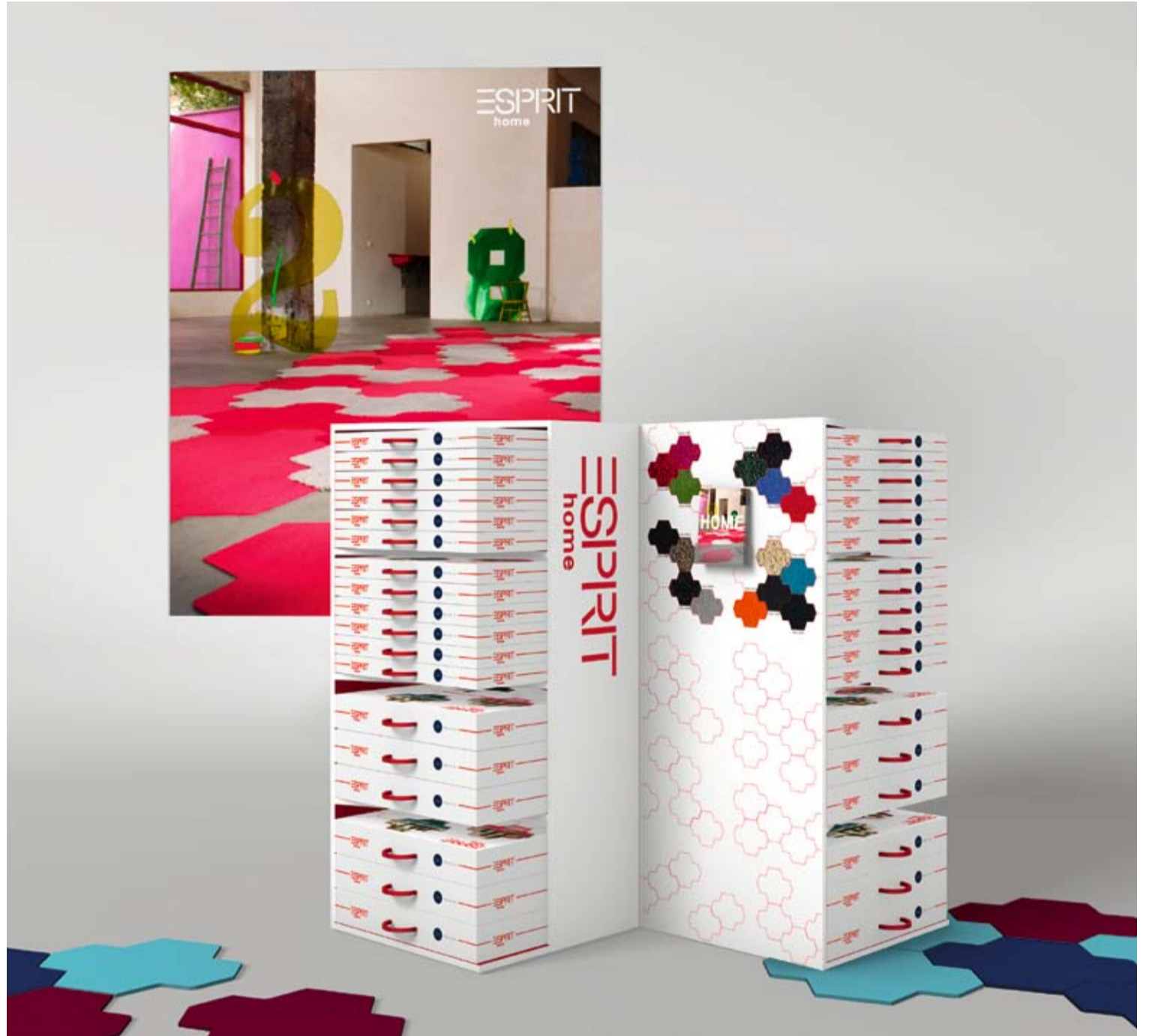
ISLANDS im Verkauf: auffällig anders.