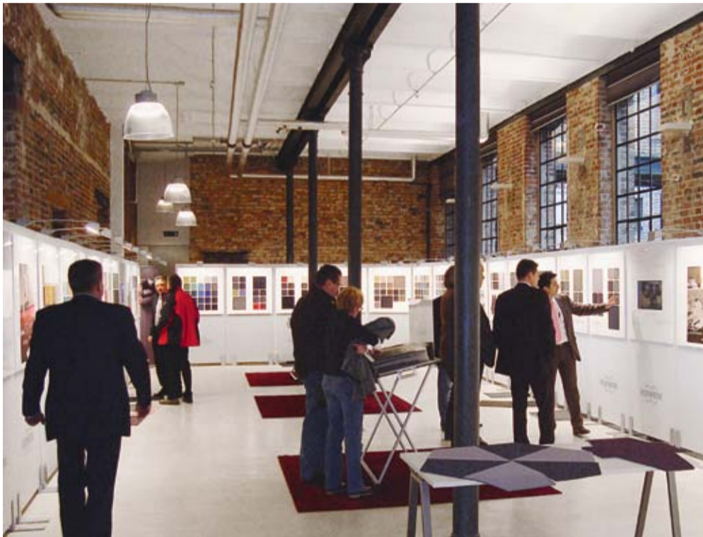
On the road: spektakuläre Locations für eine spektakuläre Kollektion.

Insgesamt konnte Vorwerk mehr als 1700 Besucher aus 560 Firmen begrüßen. Zusätzlich konnte mit der Produkt-Show ein großer Anteil an Großhändlern und Kollektionsvermarktern gewonnen werden. Dadurch entsteht bereits zur Einführung ein hoher Marktdruck, von dem alle profitieren.